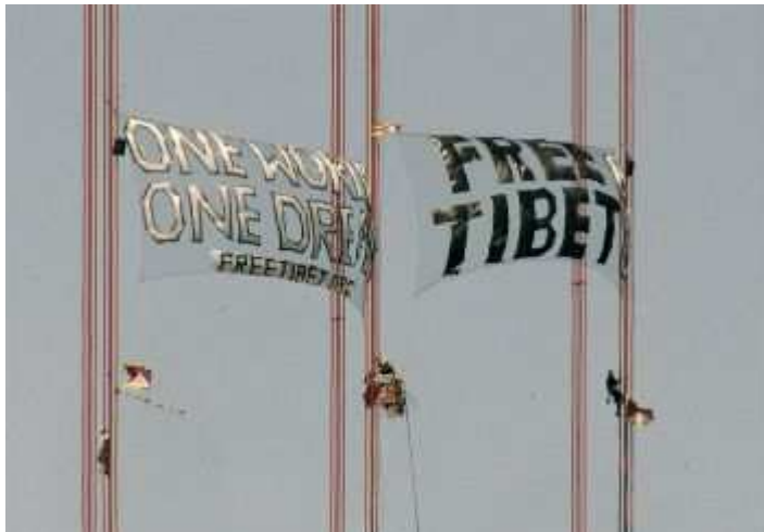
FOTO : Vessilli a S. Francisco

Riportiamo alcune riflessioni sulle posizioni politiche : ad esempio gli umanisti chiedono ai governi di BOICOTTARE le Olimpiadi (che è una posizione già presente nei vari governi, ad esempio quello francese, e che probabilmente vorrà dire non presenziare alla cerimonia di apertura).