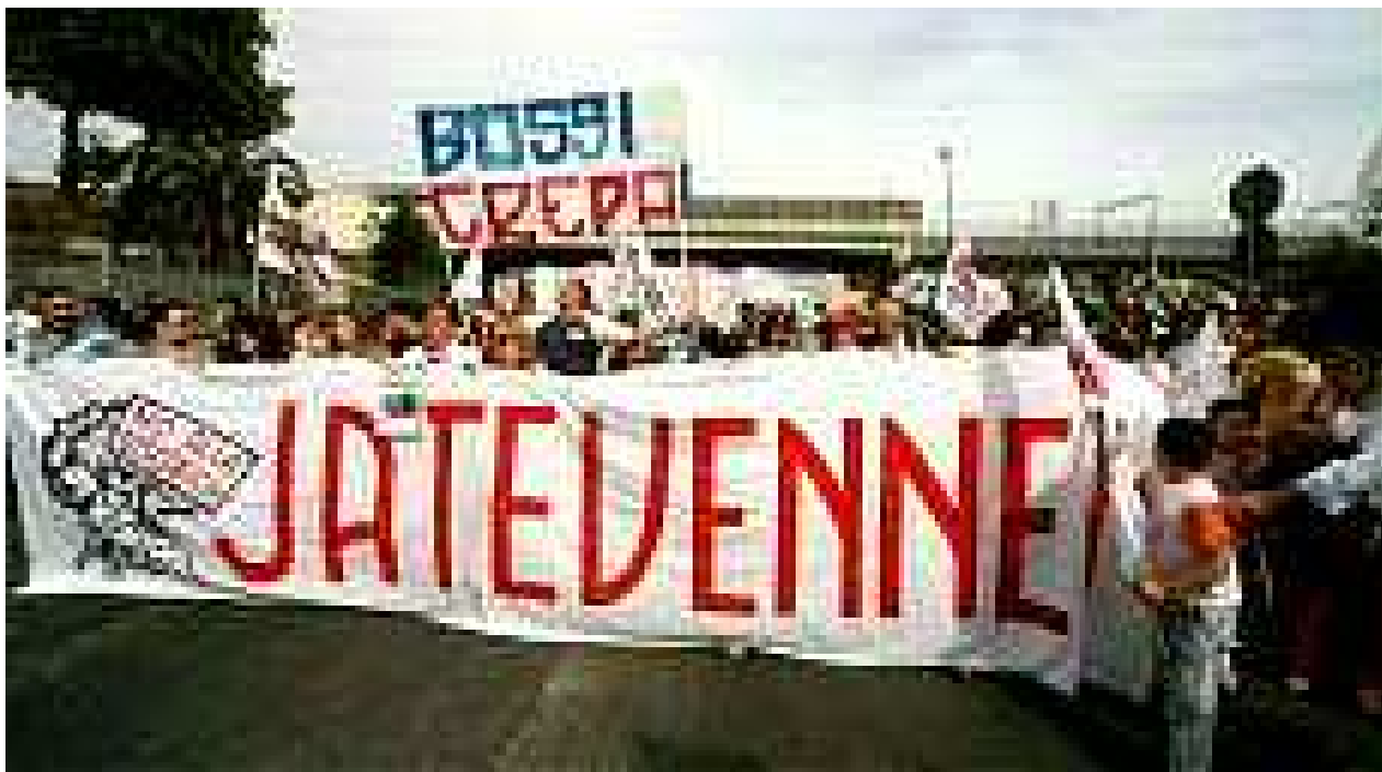
Manifestazione nazionale domenica 1 giugno 2008 : Jatevenne ...da Chiaiano !

SPECIALE RIFIUTI – CON REPORT DA COLLEGAMENTI INTERNAZIONALISTI