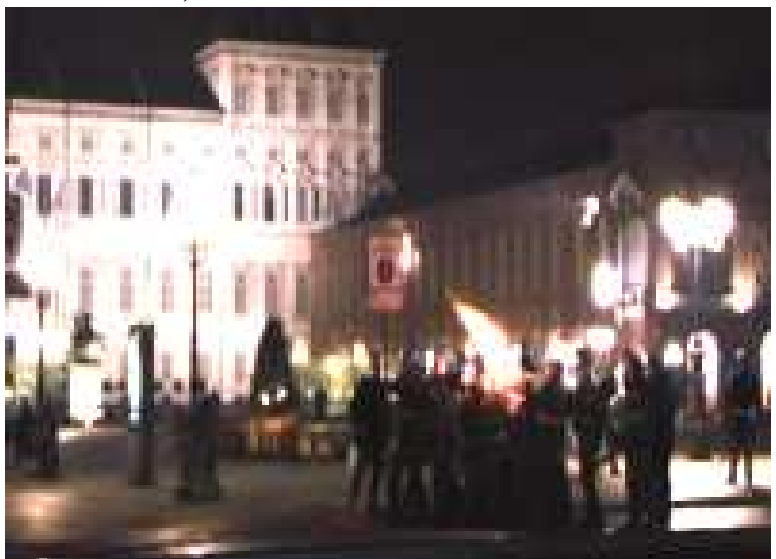
Vedi FOTO : Lacrimogeno in Piazza Castello

Un ragazzo del comitato di solidarietà è stato accerchiato e picchiato da 10 agenti della polizia che gli hanno rotto un braccio, migranti e antirazzisti hanno cercato di difendersi a la Polizia ha dichiarato che sei agenti sono stati colpiti con pietre e bastoni e medicati al pronto soccorso.