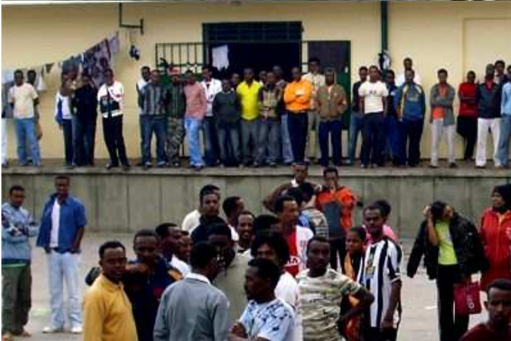
Pag 22 LE NORME DEL “PACCHETTO SICUREZZA”

RIFUGIATI RESPINTI DALL'ITALIA AL PORTO DI TRIPOLI (sopra) E NEI CENTRI DI DETENZIONE LIBICI (a sinistra)