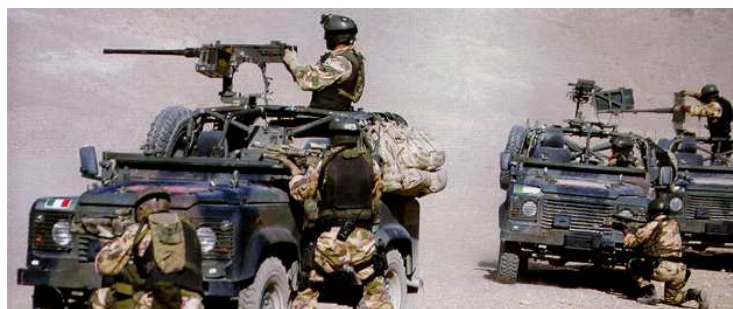
VEDI foto : operazione militare italiana con i Lince).